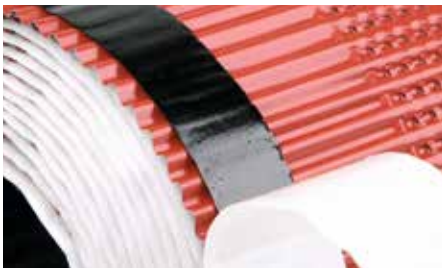
25 mm breite Klebefläche