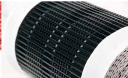
Haftungsoptimierte Roof Grip Extreme -Technologie